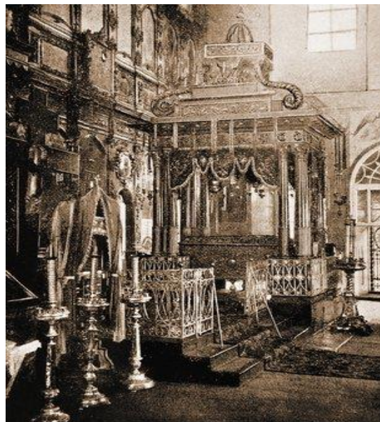
Рака с мощами свт. Арсения в Успенском соборе. Фото. Нач. XX в. (ГПИБ)

В 1606 году поляки и литовцы воевали с Русью, опустошая многие города и обители. Надеясь на богатую церковную добычу, ворвались враги и в Желтиков монастырь. Но иноки успели спрятаться с монастырскими ценностями. Только на мощах святого оставался шитый золотом покров с его изображением. Один из захватчиков схватил с мощей святого покров и положил на своего коня. Но лишь только он сел на лошадь, как вдруг неведомой силой лошадь и всадник были приподняты на воздух, а потом низвергнуты на землю. От сильного удара они умерли, а покров дивным образом поднялся на крышу Успенского храма. Покров этот и доныне сохраняется в монастыре.