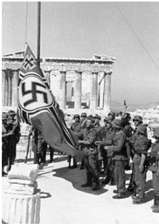
Оккупация Греции

Он также строго запрещал впускать на территорию обители немецкие войска. И всё же однажды немец - управляющий острова - приказал отдать одно из зданий обители под артиллерийский склад. Митрополит Хиоса протестовал против этого, но безуспешно. Преподобный Анфим, узнав об этом, весьма опечалился. Немцы не только планировали придти в монастырь, но и разместить здесь оружие. Старец понимал, что об этом могут узнать войска союзников, и тогда они непременно разбомбят обитель. С другой стороны, в случае сопротивления приказу оккупантов сразу последовало бы возмездие в отношении самой обители и ее насельниц... Как всегда, преподобный припал к иконе Божией Матери, умоляя Её о заступлении. После молитвы он успокоил испуганных плачущих сестёр: «Не бойтесь, ничего не случится».