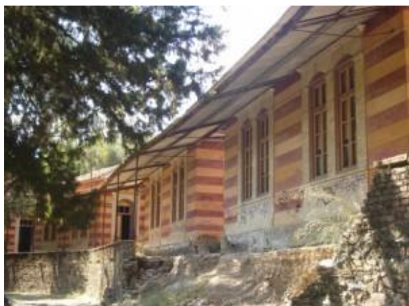
Лепрозорий, где служил преподобный Анфим

В той же деревне жил человек, одержимый бесом. Он был прикован железной цепью к большому платану. День и ночь он дико кричал, скаля зубы и испуская изо рта пену. Жители деревни хотя и кормили его из сострадания, но подходить к нему близко боялись из-за его нечеловеческой силы и ужасных бранных криков. Много раз приходил священник, издали читал молитвы об изгнании нечистого духа, но человек тот так и оставался бесноватым. Вскоре после рукоположения святого Анфима крёстный сказал ему: "Ну что, батюшка, почему бы тебе не сходить и не почитать молитвы над тем несчастным?" Святой ответил, что недостоин, чтобы его считали способным изгонять бесов, но по настоянию