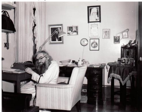
Святитель Иоанн в своей келье в Сан-Франциско

Обращаясь к истории и прозревая будущее, свт. Иоанн говорил, что в смутное время Россия так упала, что все враги ее были уверены, что она поражена смертельно. В России не было царя, власти и войска. Люди «измалодушествовали», ослабели и спасения ждали только от иностранцев, перед которыми заискивали. Гибель была неизбежна. В истории нельзя найти такую глубину падения государства и такое скорое, чудесное восстание его, когда духовно и нравственно восстали люди. Такова история России, таков ее путь. Последующие тяжкие страдания русского народа есть следствие измены России самой себе, своему пути, своему призванию. Россия восстанет так же, как она восстала и раньше. Восстанет, когда разгорится вера. Когда люди духовно восстанут, когда снова им будет дорога ясная, твердая вера в правду слов Спасителя: «Ищите прежде Царствия Божия и Правды Его и вся сия приложатся вам».