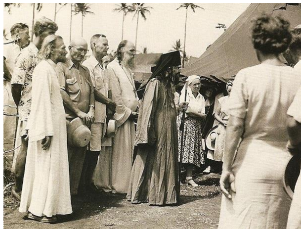
Святитель Иоанн посещает лагерь русских беженцев на Тубабао

причин для беспокойства нет, поскольку «ваш святой человек благословляет ваш лагерь каждую ночь со всех четырех сторон». Когда же лагерь был эвакуирован, страшный тайфун обрушился на остров и полностью уничтожил все строения.