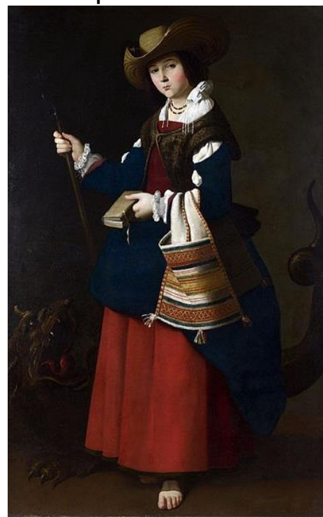
Франсиско де Сурбаран «Святая Маргарита». Национальная галерея, Лондон.

Когда святую вывели на место казни, она попросила немного подождать тех, кто вел её, и, обратившись к следовавшему за ней народу, увещевала всех познать единого истинного Бога и уклониться от гибели идолопоклонства. Потом она долго молилась за всех и вдруг сотряслась земля и многие упали от страха на землю; упал и палач. Это Господь наш Иисус Христос явился с неба со святыми ангелами, призывая святую в свой покой и простирая руки, чтоб принять её душу. Она же, несказанно обрадовавшись, побудила палача, чтоб он поскорее исполнял, что ему приказано.