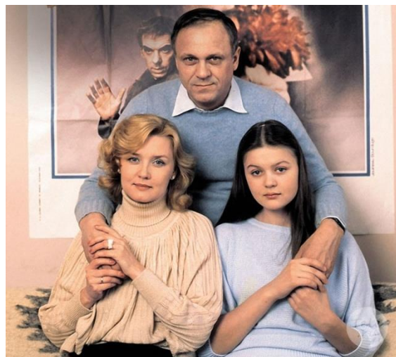
Владимир Меньшов – с супругой актрисой Верой Алентовой и юной дочерью Юлией Меньшовой, будущей телеведущей популярных программ «Я сама», «Наедине со всеми» и «Сегодня вечером».