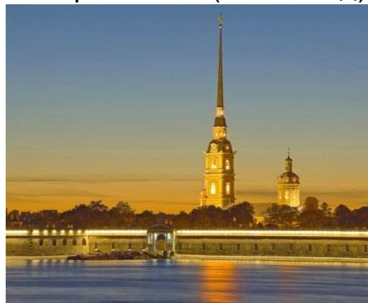
Петропавловский собор. Санкт-Петербург

В Петропавловском соборе хранились многочисленные военные трофеи – знамена, оружие, ключи от взятых крепостей и городов. Здесь же расположены гробницы всех русских императоров, начиная с Петра I, за исключением Петра II и Ивана Антоновича.