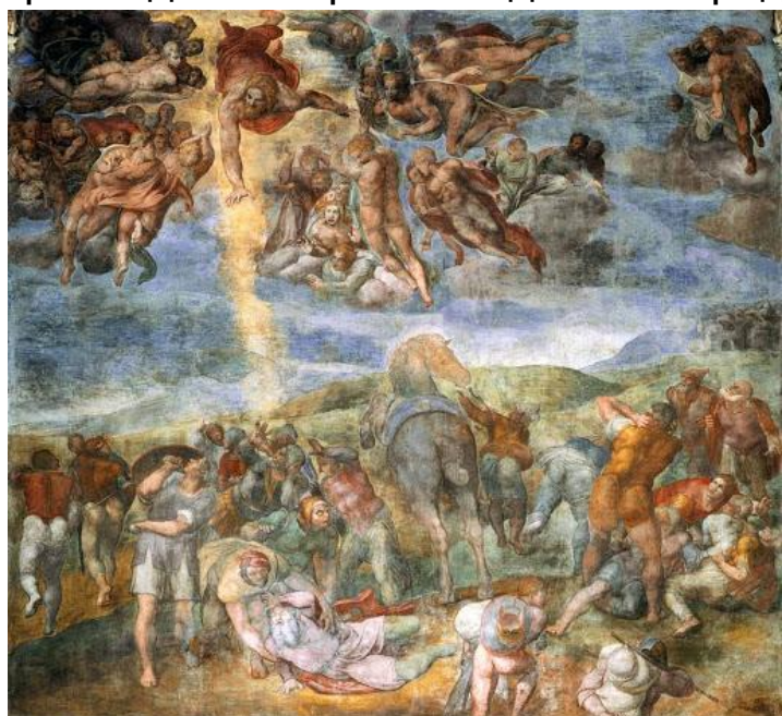
Обращение Савла. Микеланджело

Савл родился в Малой Азии, в городе, многие жители которого, будучи иудеями, тем не менее, имели права римских граждан (которое давало реальные привилегии, право на особую государственную защиту и рассмотрение любых обвинений в императорском, римском суде. Для еврейского народа с его монотеизмом это было явлением, сравнительно редким. Получил хорошее образование в Иерусалиме и, видимо, готовился к должности раввина. После окончания учебы он получил власть официально преследовать христиан даже за пределами Палестины – в Дамаске.