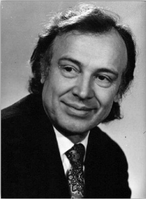
Народный артист СССР Иннокентий Смоктуновский (1925-1994):

оказался далеко от страшного арьергарда колонны. Мне ведь было 17 лет и не хотелось умирать.