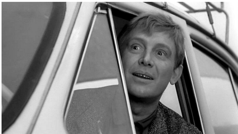
Иннокентий Смоктуновский – в роли Юрия Деточкина в фильме «Берегись автомобиля»

Без веры человек не вышел бы из лесу, хрюкал бы, выл... Свинья — это хорошо, это замечательно, но все-таки разума у неё нет, а у нас помимо разума есть и душа. Источник: «Неопознанный мир веры», митр. Тихон Шевкунов