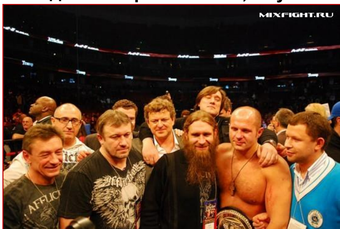
Фёдо Емельяненко - с духовным наставником отцом Андреем.