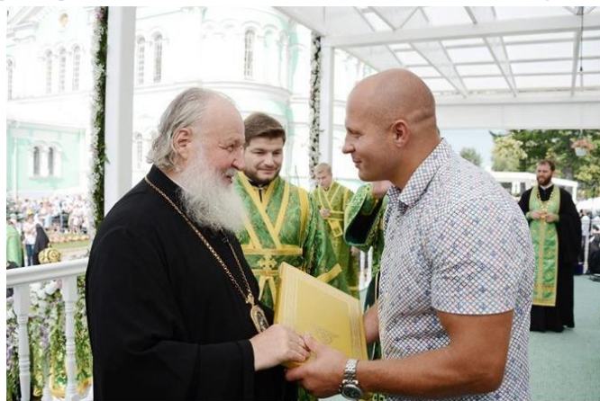
Патриарх Кирилл и Ф. Емельяненко.

– Да, слава Богу, что у нас такой Патриарх. Слава Богу, что наш Святейший Патриарх Кирилл переживает и заботится о своей пастве. У него - огромный жизненный опыт, он очень умный человек. Все его проповеди строятся на каких-то личных жизненных примерах. Ну, и, конечно, бывая с ним на службах, слыша его проповеди, мы видим, как он радеет о своей пастве.